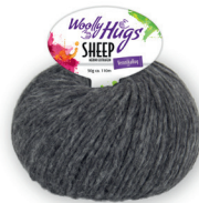
Farbe Nr. 98

Art. Nr.: 27 2100 A/11 | Hersteller Woll: L&K, D-79774 Albbbruck | Layout und Materialfotos: Elke Engel · crealoop.me