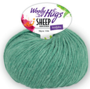
Farbe Nr. 72