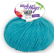
Farbe Nr. 65