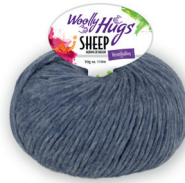
Farbe Nr. 55