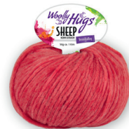
Farbe Nr. 30