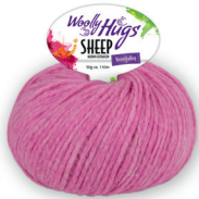
Farbe Nr. 37