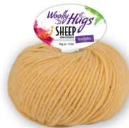
Farbe Nr. 22