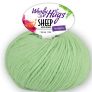
Farbe Nr. 77