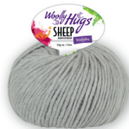
Farbe Nr. 90