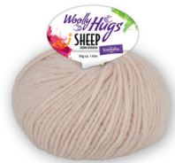
Farbe Nr. 05

50% Wolle (Merino extrafein) 28% Baumwolle 22% Polyamid Lauflänge 110m/50g Nadelstärke 5,5 – 6,5